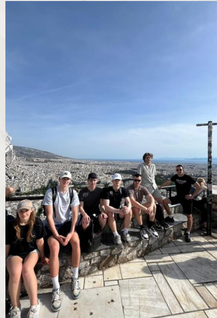
Skats uz Atēnām no kalna