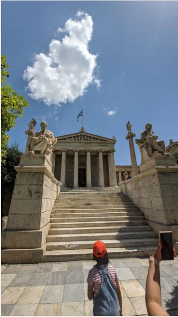
Atēnu Zinātņu akadēmija